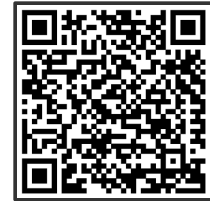
All Learning Content Related to this Topic

Solutions: Guten Morgen, ich glaube wir kennen uns noch nicht. / Guten Morgen. Nein, das tun wir nicht. Ich heiÙe Andreas Horn. / Ich freue mich, Sie kennenzulernen, Herr Horn. Ich heiÙe Laura Becker. / Wie geht es Ihnen, Frau Becker? / Es geht mir sehr gut. Wie geht es Ihnen? / Auch sehr gut. Fr welches Unternehmen arbeiten Sie? / Ich arbeite bei Ferox, einer Computerfirma mit Sitz in Stuttgart. / Haben Sie schon Herrn Brandt von CompeX kennengelernt? Er ist auf Computertechnik spezialisiert. / Nein, noch nicht. / Ich stelle Sie vor. Ich denke, Sie wren daran interessiert, etwas ber seine Firma zu erfahren. / Gerne.